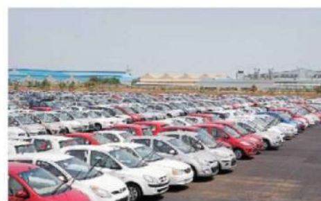
While channel inventory is around 200,000 units, backorders are well over 700,000 units

Hyundai was in a tight race with rival Tata Motors, at the number three spot, as its production between January and May suffered due to the supply-side challenges. However, easing semi-conductor chip availability has led to a 10% increase in production over the last three months. "From January to May we were able to produce 43,000-44,000 units a month. We are now hovering around 49,000 units so there has