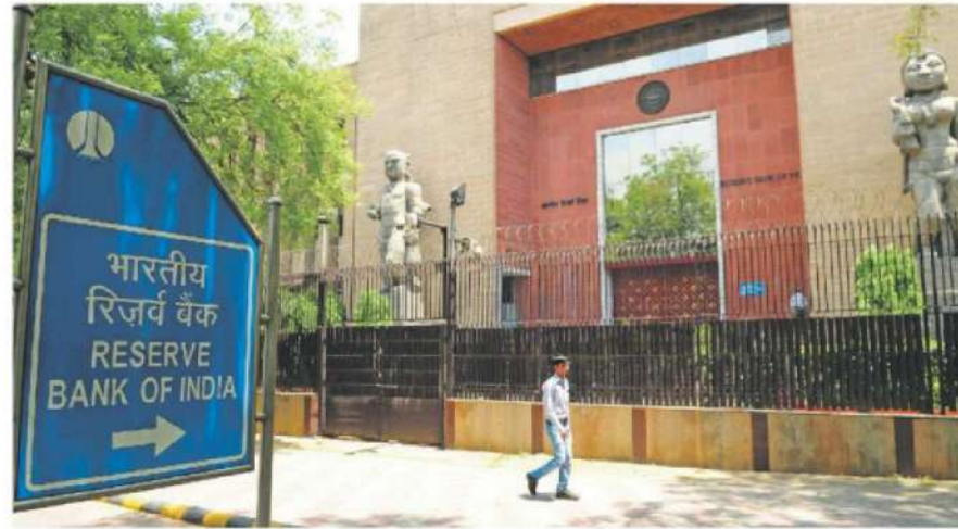
While the amendment came into force for urban cooperative banks with retrospective effect from 29 June 2020, for state cooperative banks and district central cooperative banks, it was effective from 1 April 2021

Before the 2020 amendment, RBI had limited powers to regulate cooperative banks, restricting its ability to take timely corrective action. While the amendment came into force for urban cooperative banks with retrospective