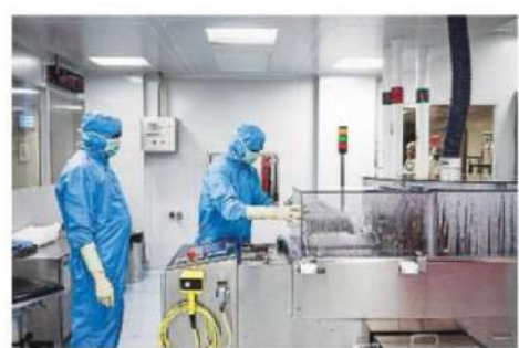
In the last two years, SII primarily focussed on developing and manufacturing Covishield following the covid outbreak. BLOOMBERG

"The firm presented its proposal for grant of permission to manufacture Diphtheria, Tetanus and Pertussis vaccines, along with phase II-III clinical trial report, recommendations by Data and